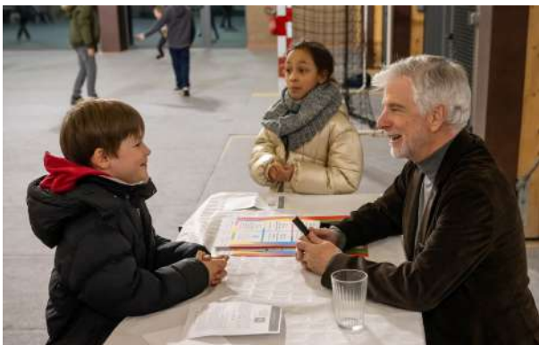
Séance de dédicaces après un concert de David LIVELY à Fromelles (59)