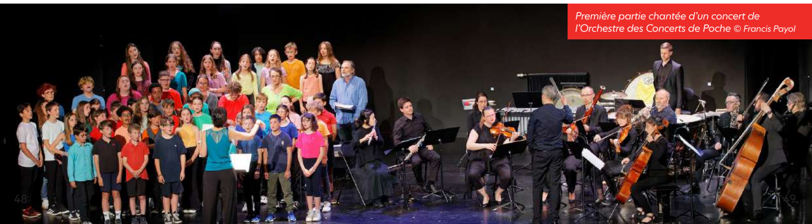
Première partie chantée d'un concert de l'Orchestre des Concerts de Poche