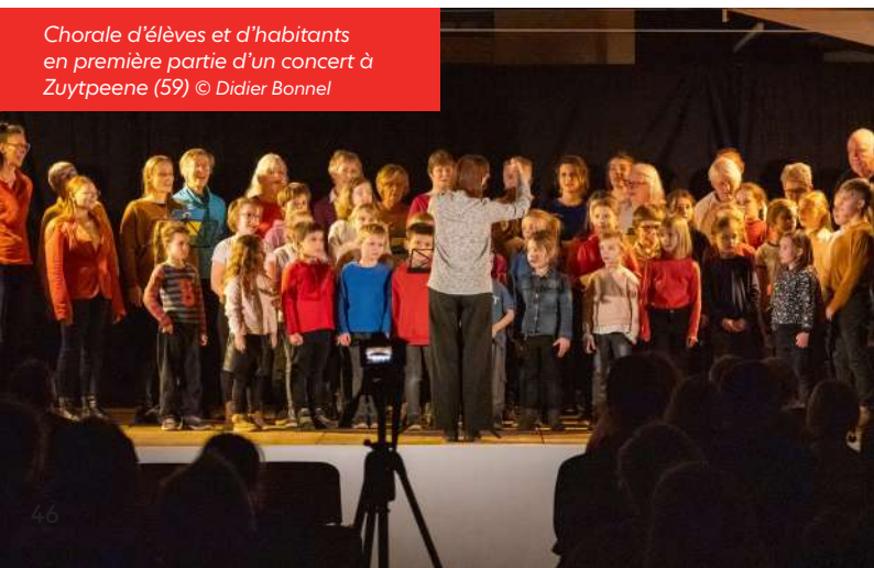
Chorale d'élèves et d'habitants en première partie d'un concert à Zuytpeene (59)