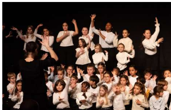
Chorale d'habitants en première partie d'un concert à Wattignies (59)